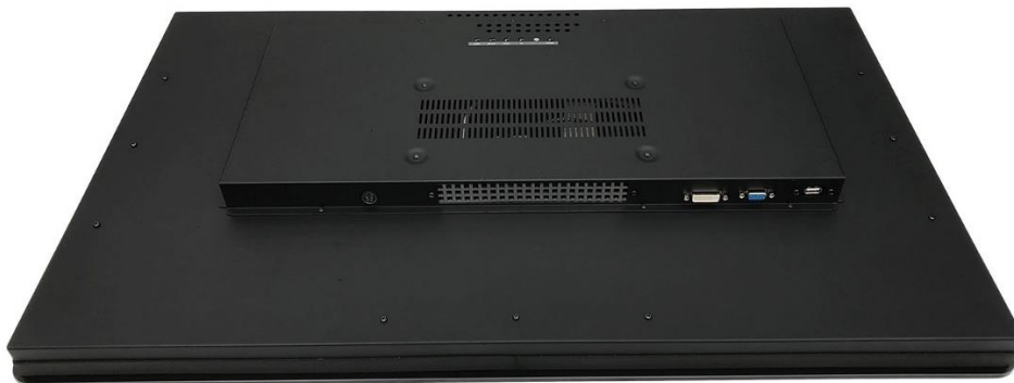
Muur montage versie (WMB) met optie PCAP touchscreen