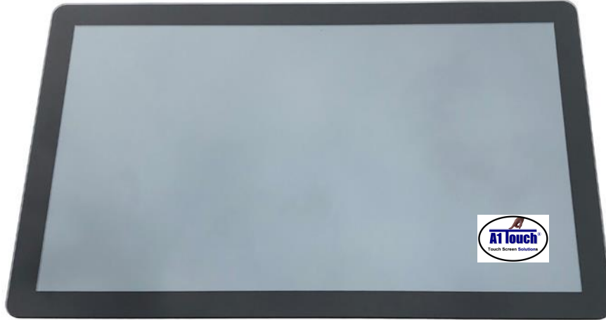
Paneel montage versie (PMB) of Achter montage versie (OF) met PCAP touchscreen