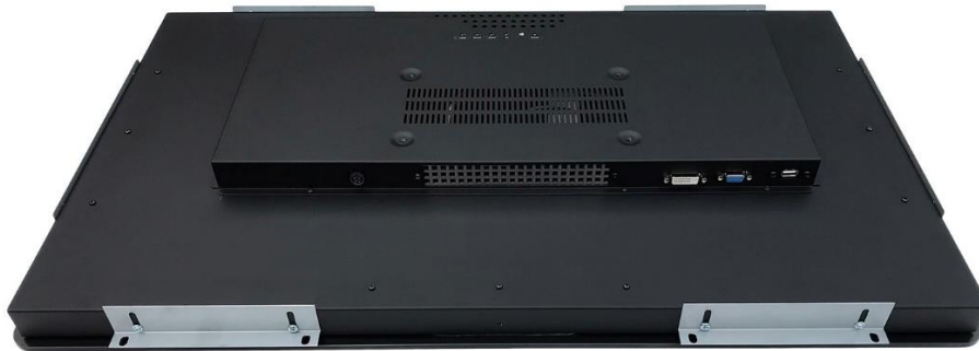
Paneel montage versie (PMB) met PCAP touchscreen